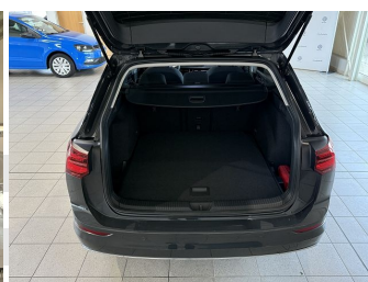
ABS Android auto Anhängerkupplung schwenkbar Bluetooth