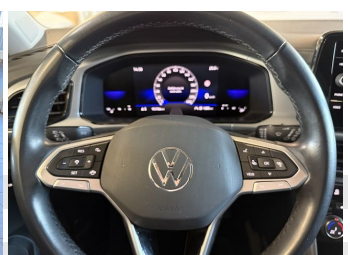
ABS Android auto Berganfahrassistent Bordcomputer